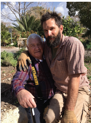
נחשול על ברכיו של ישקה ז"ל